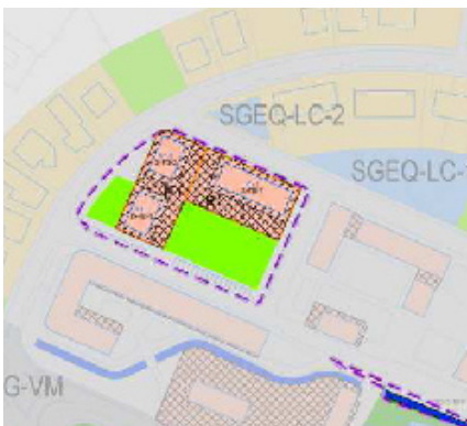
A.I. 5 Topaleku ondoko eremua